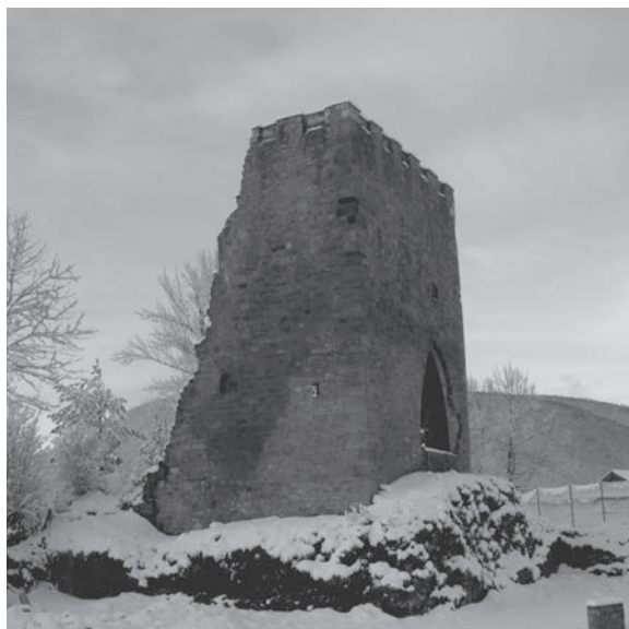
Torreón de Boca de Huérgano.

EL MARQUÉS DE PRADO cobraba en los 17 lugares de su jurisdicción a cada vecino del estado general, por quitarles que sirviesen como mozos de mulas del marqués, una fanega de trigo, una gallina y 18 maravedíes al año; a los hijosdalgos, 14 cuartillos de pan mediado; a los eclesiásticos, la luctuosa*. También cobraba a los concejos de Valdetuéjar y La Guzpeña distintas cantidades por los impuestos de yantar y humazga: al párroco de Renedo, media carga de pan por patronato; al concejo de La Llama, un foro de siete cargas de trigo por el uso de una fuente. Gozaba además de un foro perpetuo consistente en edificios y heredades en Santa Olaja de la Acción, que arrendaba por tres cuentas de lino espadado, de cuatro libras cada una y dos gallinas vivas en cada año. Tenía asimismo varios foros sobre molinos, como los de Las Muñecas, San Martín, Sta. Olaja de la Acción y otros, por cuyo arriendo le paga-