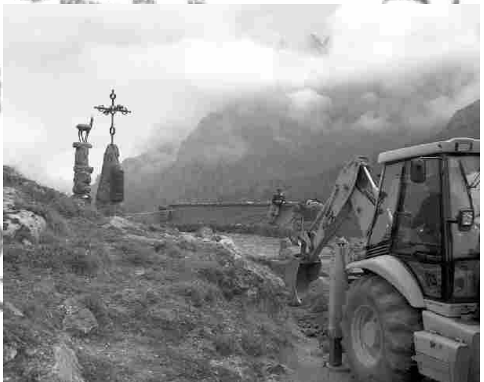
Mirador del Tombo

Sinceramente, no hay que hacer más que darse una vuelta por los pueblos de nuestra comarca, para hacer un listado enorme de todo aquello que no es desarrollo, y esto no sería lo peor si no fuera porque encima