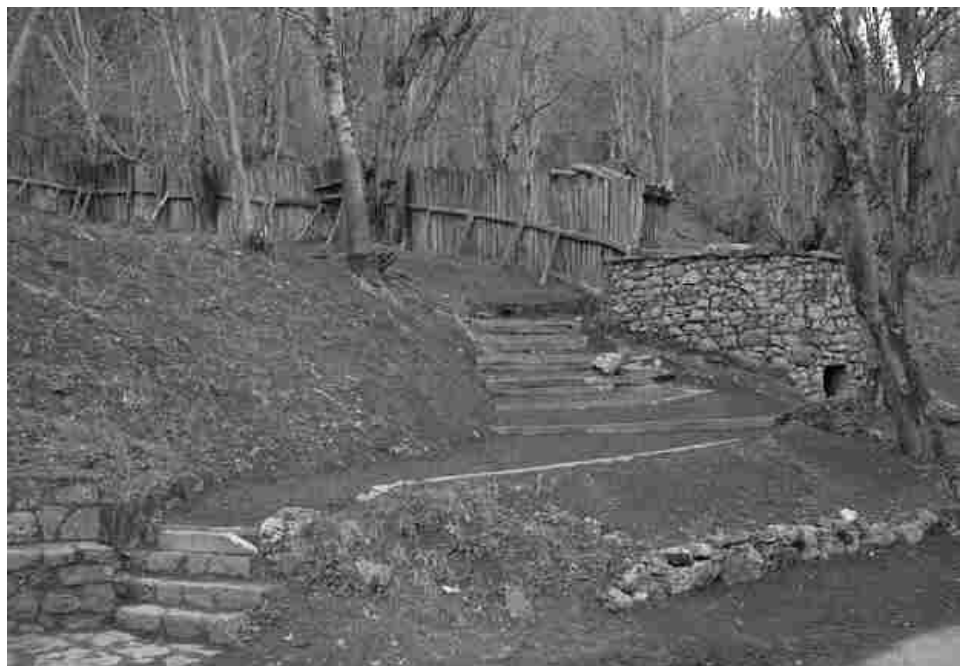
Acondicionamiento del Chorco de los lobos

Nos parece que ahora, con el PRUG aprobado y una ley que prevé la extinción de la caza en seis años, a medida que pase el tiempo la capacidad de negociar la compensación es mucho menor y sólo queda esperar que la Administración Central sea generosa para con los valles de Sajambre y