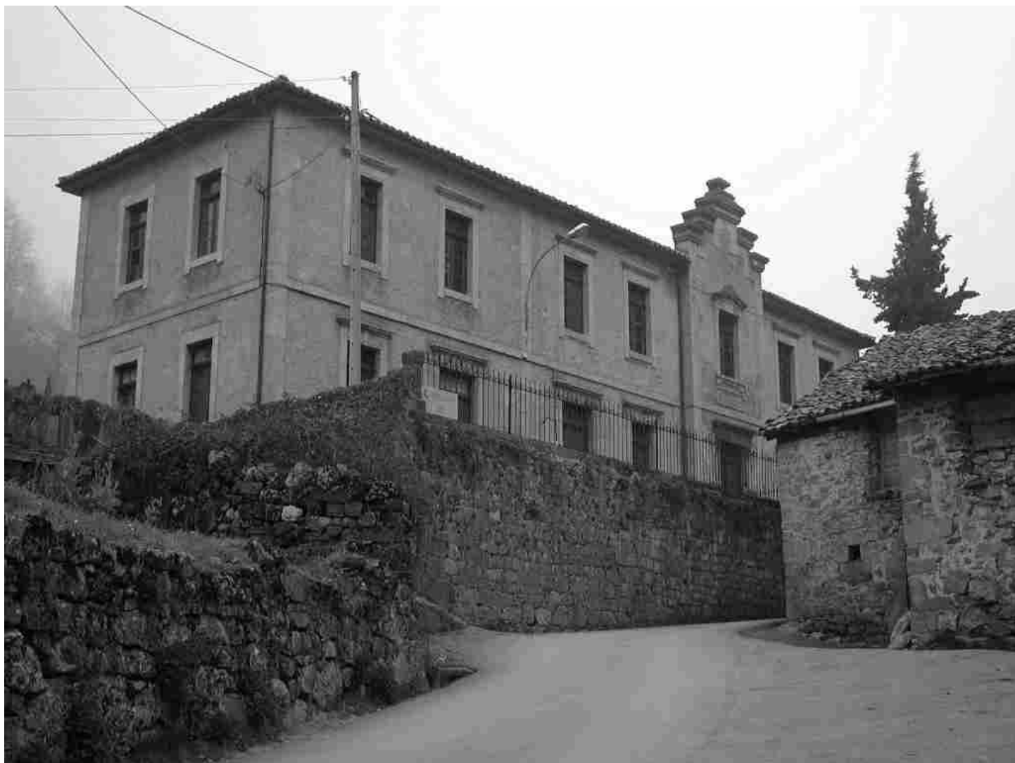
Escuelas de Soto de Sajambre