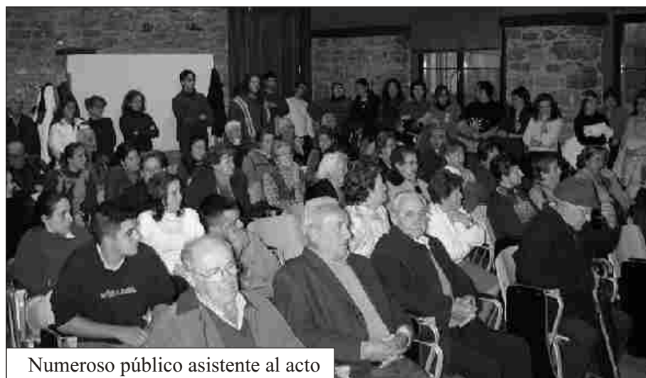
Numeroso público asistente al acto