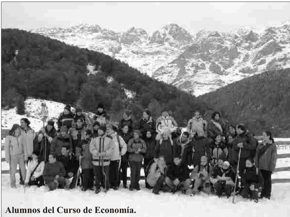
Alumnos del Curso de Economía.

Al cierre de este número ha concluido también la decimotercera