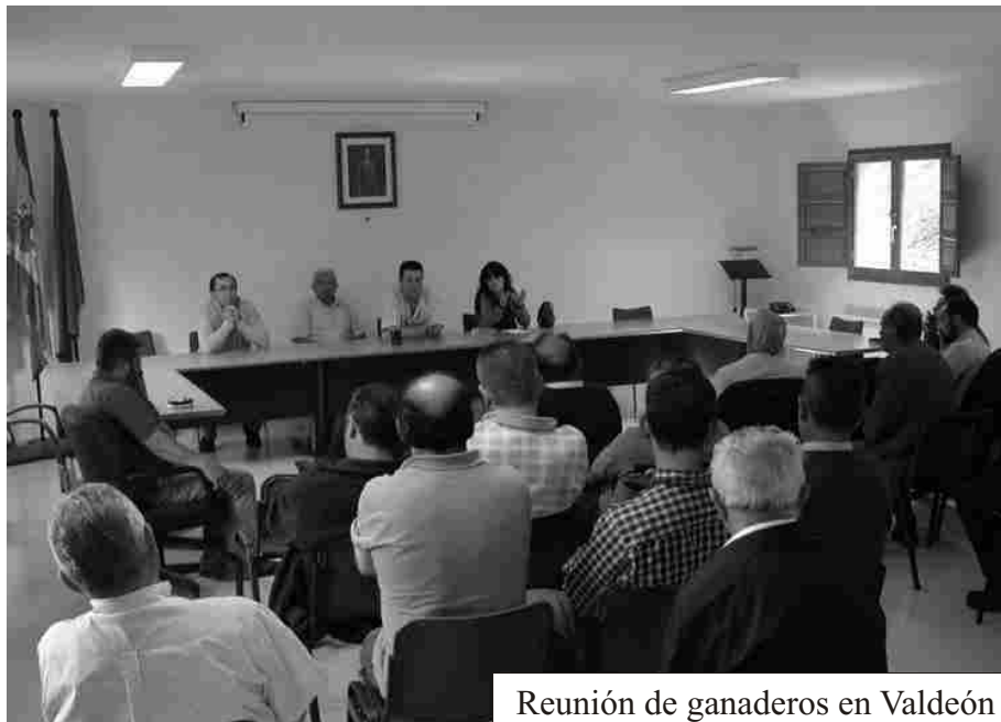
Reunión de ganaderos en Valdeón