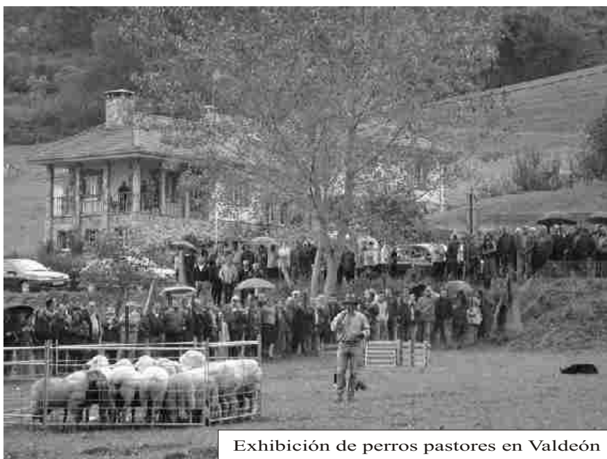
Exhibición de perros pastores en Valdeón

La feria de Valdeón recuperó el concurso de ganado y abarcó tanto el aspecto ganadero tradicional como la exposición y venta de productos autóctonos. En Riaño y Sajambre las ferias destacaron por los puestos de venta ambulante y de productos tradicionales.