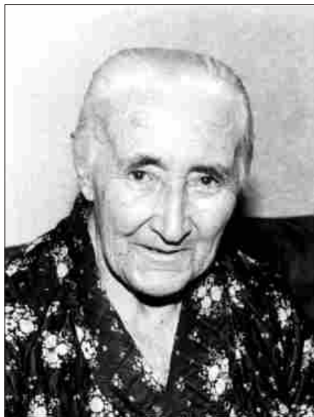
Texto y fotografía: Javier Valcarce Pedroche.

Nace Cipriana Mateo Pedroche en Barniedo de la Reina el